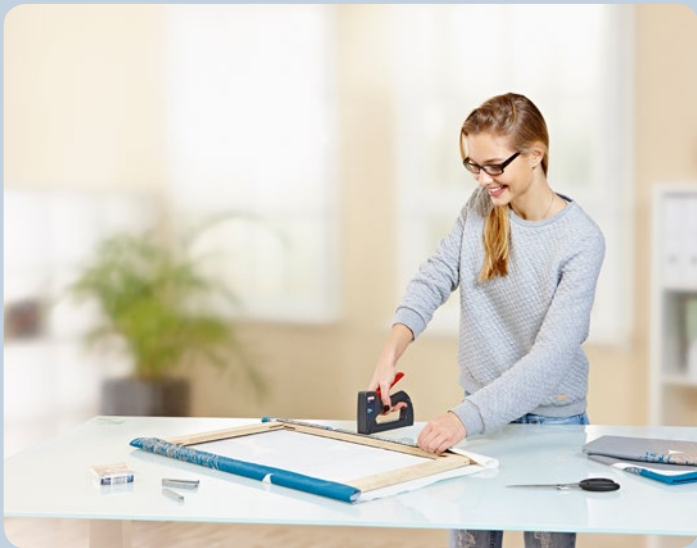
Schnelles Bespannen von Bilderrahmen.