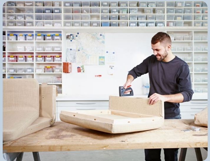
Polsterarbeiten ganz einfach mit dem Tacker erledigen.